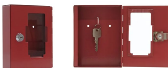
Eksempel på indvendige nøgleboks ved ABA-anlægget

Nøglen til betjening af ABA-anlægget skal placeres i den udvendige nøgleboks, alternativt skal der opsættes en nøgleboks for brandvæsenet ved siden af ABA-anlægget, som kan låses op med den hovednøgle/brik der findes i den udvendige nøgleboks. Kodelåse accepteres ikke.