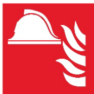
Godkendt skilt 105x105 mm

Nøglebokse/nøglerør skal placeres i umiddelbar nærhed af den adgangsmulighed, som de betjener, og de skal være tydeligt markeret med et skilt.